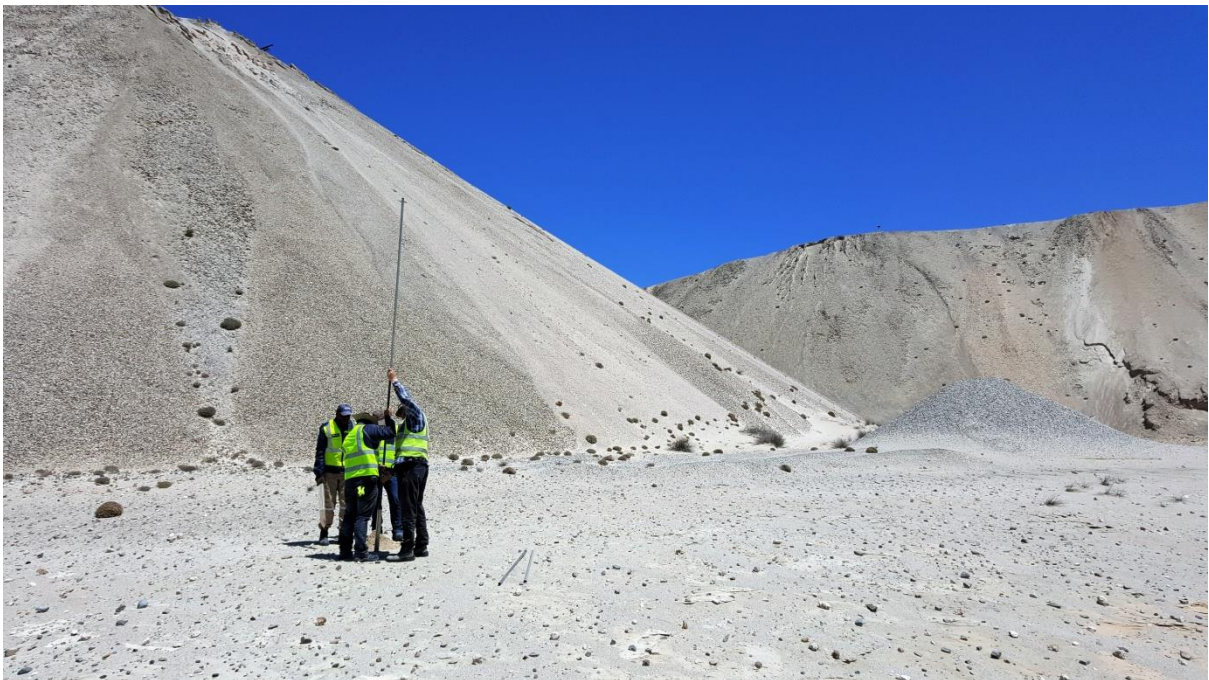
Sampling by die Gifkop slikdam met die growwe uitskothope op die agtergrond.