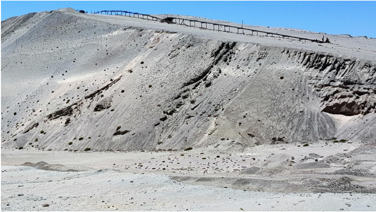
Rietfontein se growwe uitskothoop.