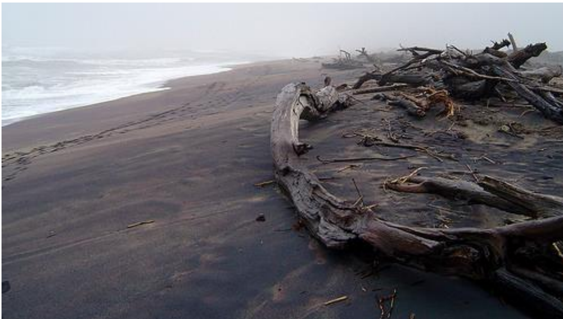
Strande met swaarminerale en dryfhout net suid van die Oranje Rivier mond.