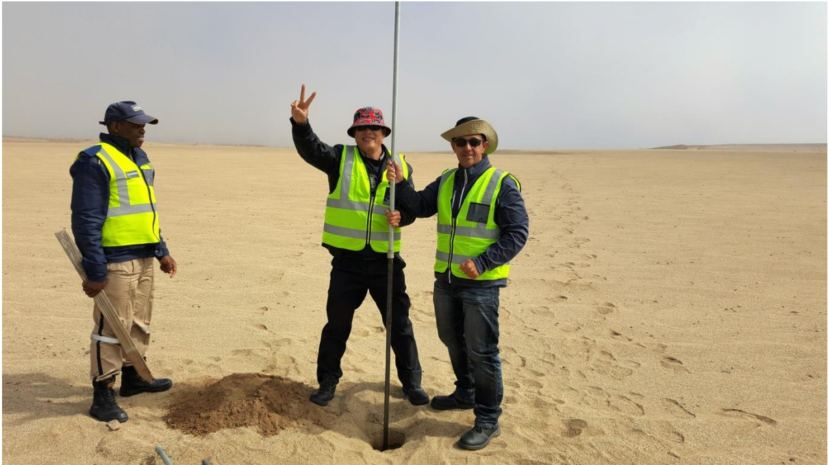
Rietfontein slikdam suksesvol gesample tot op 8m en 'n baie gelukkige Chinees wat verwonderd deur Alexkor se sekuriteits beampte beskou word.