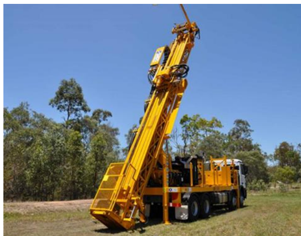
Setshwantsho sa 2: Sebaka se tlwaelehileng sa mokoti o borilweng

Ho bora mokoti le ho kenya samente ke mokwallo o lekilweng o thusang hore ho borwe karolo e latelang, ho dumella ho fihlella botebo boo ho tsepamisitsweng ho bona ka mokgwa o bolokehileng.