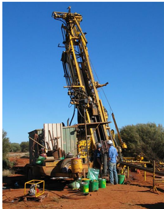
Setshwantsho sa 2: Mohlala wa ditshebetso tsa ho bora

wa ho bora sediba jwalo ka ha ho hlahositswe mona ka hodimo (mme o tla hlahoswa ka ho batsi ho Scoping le EIA Report). Phuputso efe kapa efe e eketsehileng kapa tlhahiso ya nako e tlang e tla hloka tumello e tswang lefapheng la DMRE. Ditumello tse jwalo di tla itshetleha ka ditlhokahalo tse tshwanelehang tsa molao tse kenyeletsang dipuisano tse eketsehileng le setjhaba le ditokolo tsa tikoloho.