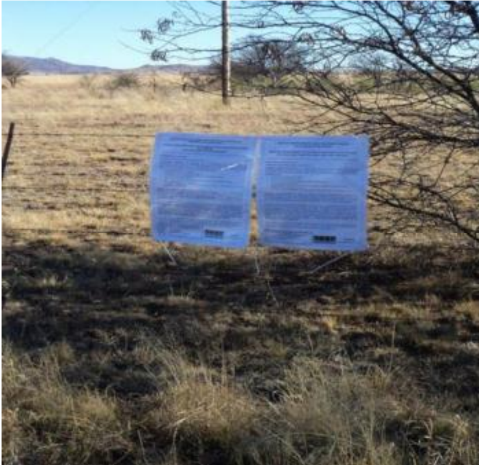
Figure 2: Site notice placed at the entrance to Portion 0 of Farm 374 Concordia