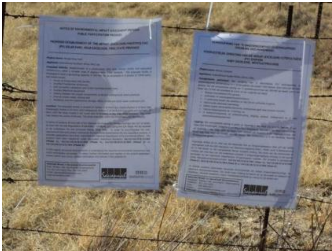
Figure 1: Site notice placed at the entrance to Portion 0 of Farm 566 Moedersgift