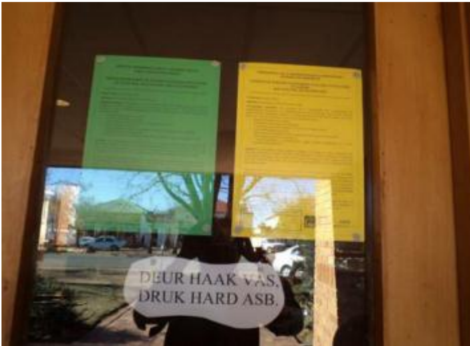
Figure 3: Site notice placed at entrance at the Excelsior Public Library