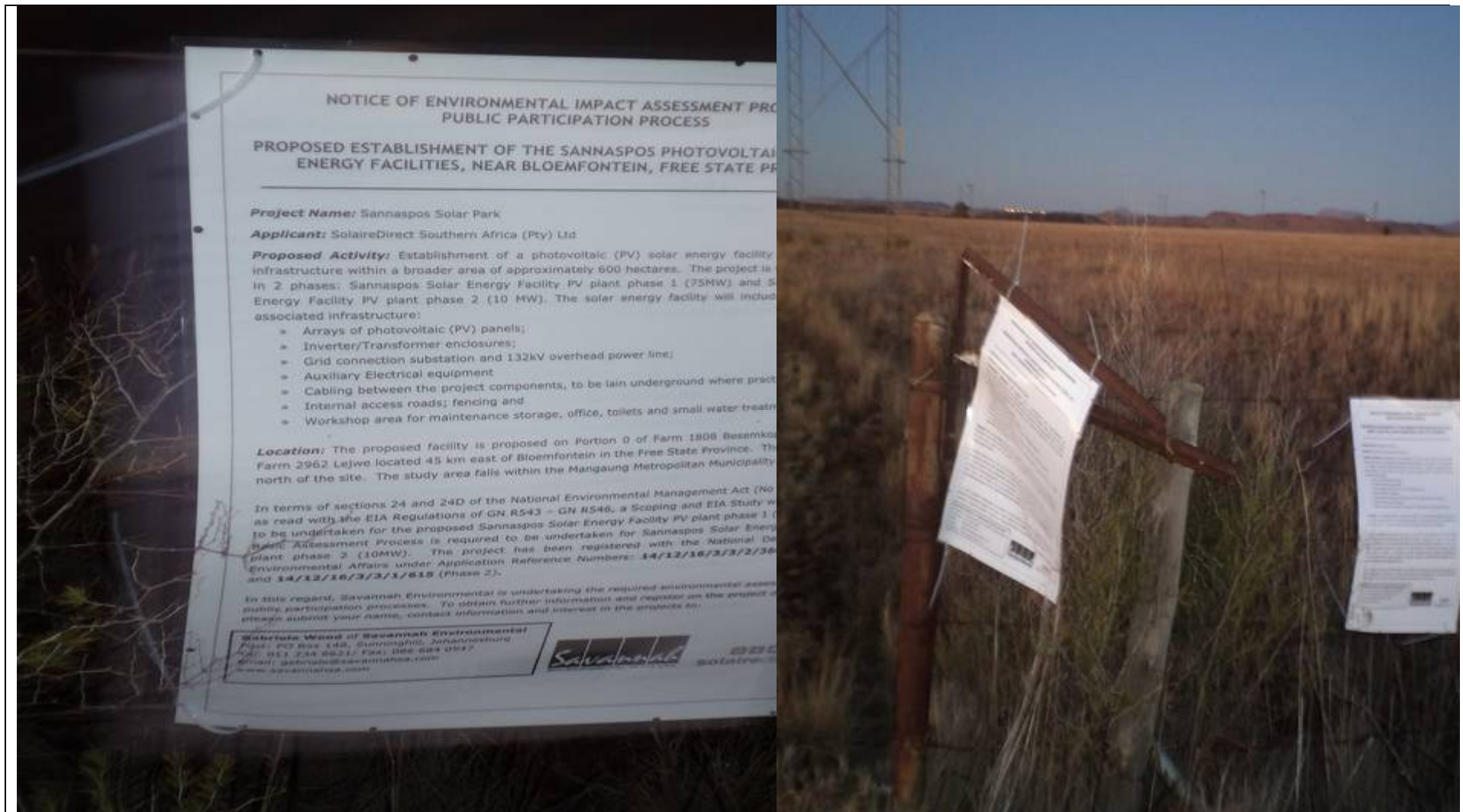
Figure 1: Site notice placed at the entrance to Portion 0 of Farm 1808 Besemkop