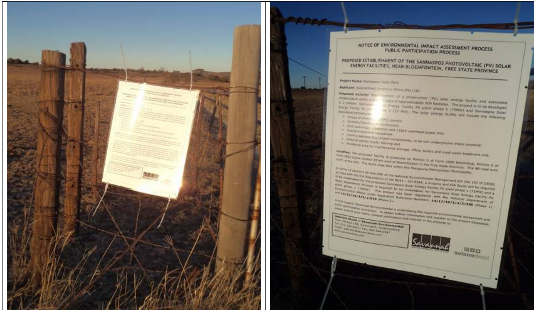
Figure 2: Site notice placed at the fence of Portion 0 of Farm 2962 Lejwe