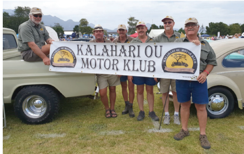
Die manne het langs die pad ook bietjie afgetrek om te rus én te spog met hul voertuie.

Op 8 Februarie die oggend 03.00 het almal buite by die Engen vulstasie gesukkel om die laaste voorbereiding te doen vir die 15 uur lange trip. Soos die gebruik daai jare mos was, het die padkos en die koffiebottel hulle plek op die agter sitplek gekry. Die vyf ou motors het toe die pad aangepak met oop ruite en flou ligte. As die pad bietjie lank word is daar eers bene gerek met lekker padkos en koffie en ja, van die voertuie het ook bietjie dors geraak.