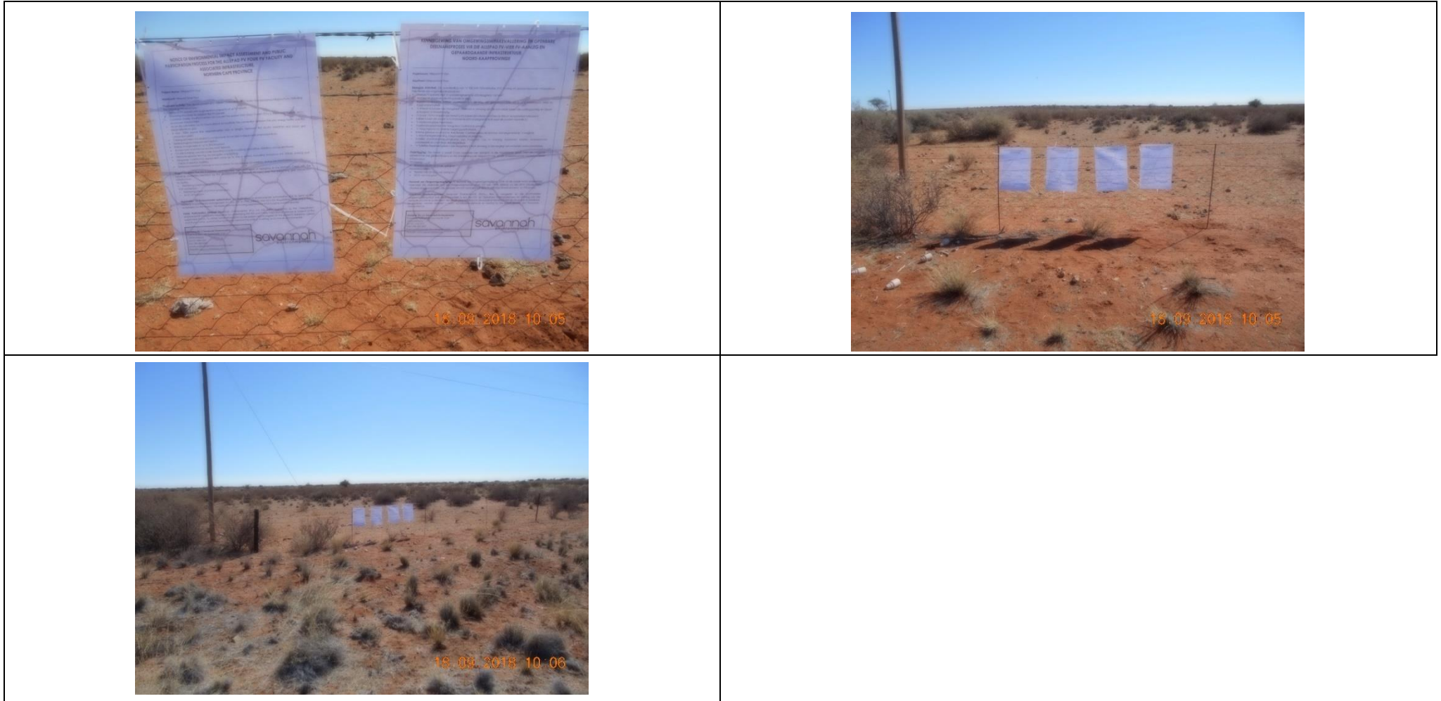
Figure 1: Photos of site notices on the boundary of the Remaining Extent of Erf 5315 Upington (28° 24' 19.58" S and 21° 08' 07.85" E).

Remaining Extent of Erf 5315 Upington – Allepad PV Three and Grid Connection Infrastructure