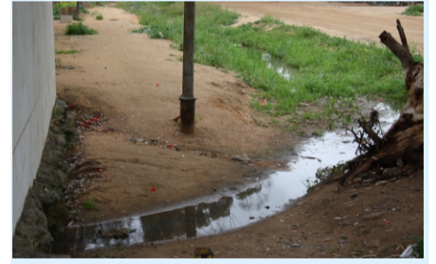
Afvoerkanale is onversorg. Water wat opdam hou 'n gesondheidsrisiko in.