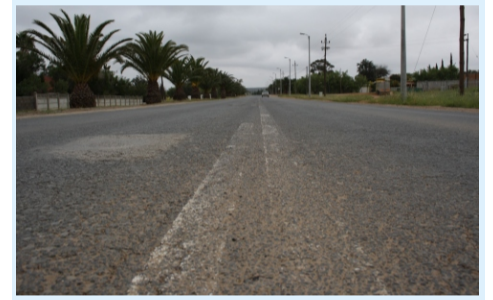
Die R362, één van die hoofpaaie deur die dorpie kort dringende instandhoudings werk.

Afriforum het reageer op Ons Kontrei se berig net voor plasing en versoek dat inwoners op 19 September 'n vergadering bywoon op Klawer om 19:00 in die Gemeenskapsaal sodat die probleme op 'n "wenslys" aangeteken kan word.