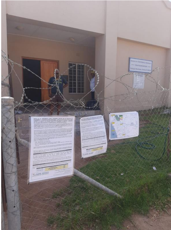
Eksteenfontein- Community Hall, Municipal Office