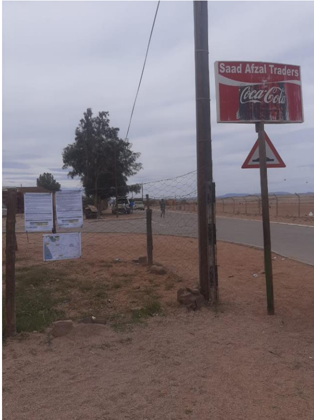
Sanddrift-Saad Afzal Traders