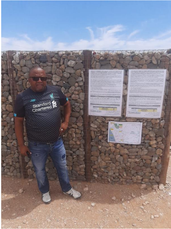
Sendelingsdrift - SANPARKS Richtersveld Park Entry Gate