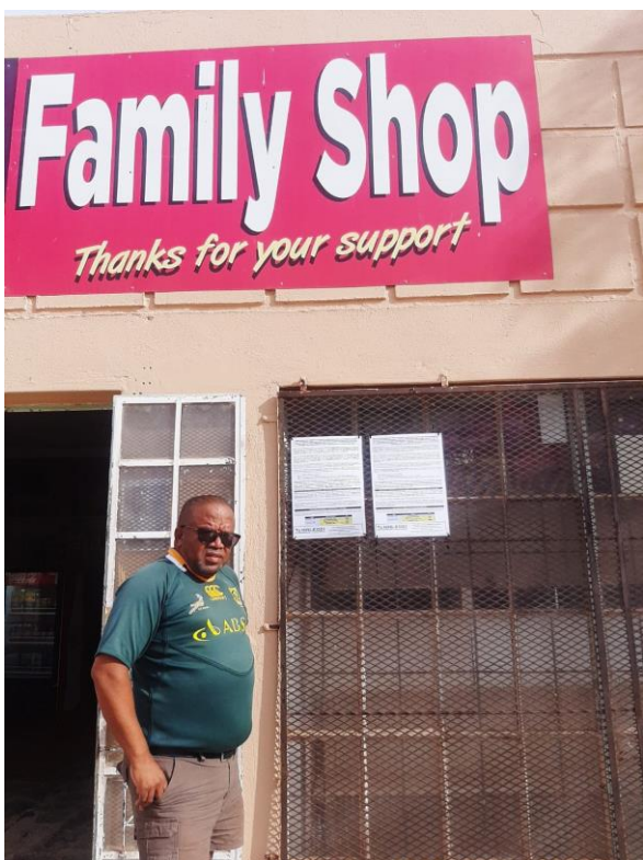
Lekkersing- Family Shop