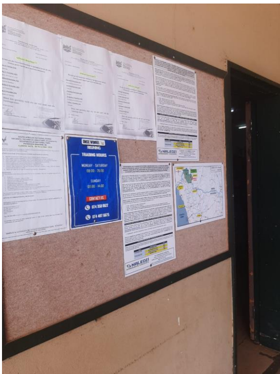
Sendelingsdrift - Kleinbegin Kafee Mini Mark