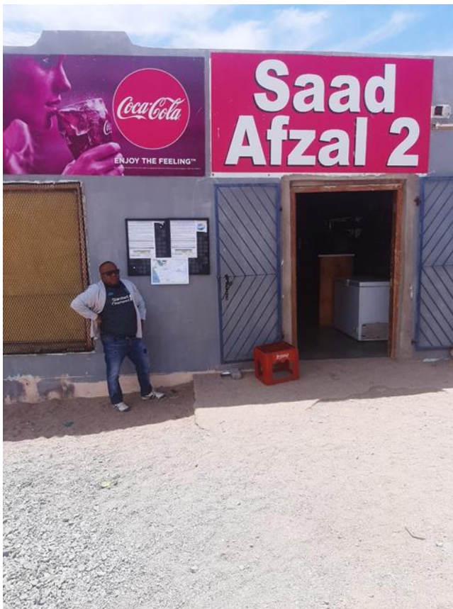
Kuboes-Saad Afzal 2 Shop