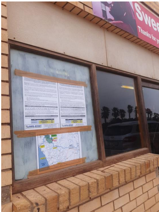
Alexander Bay -Engen filling station