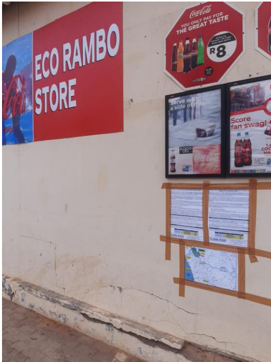
Alexander Bay -Eco Rambo Store