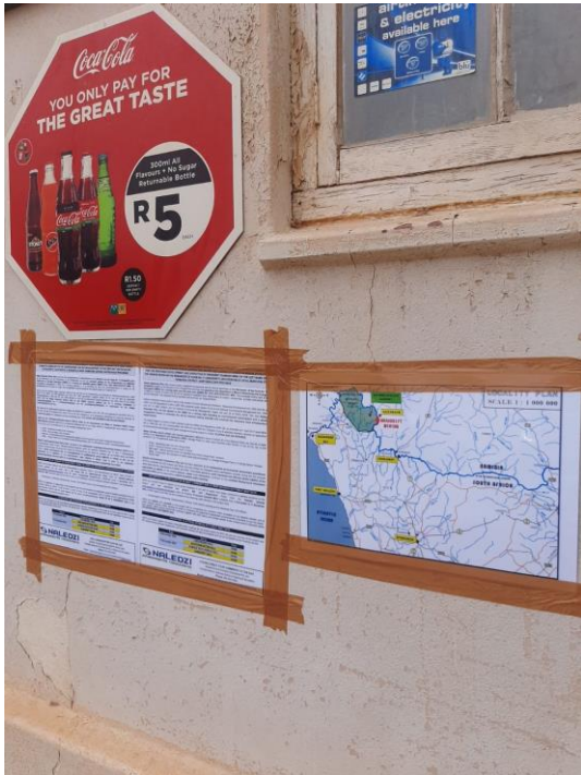
Alexander Bay-Random Ons 2