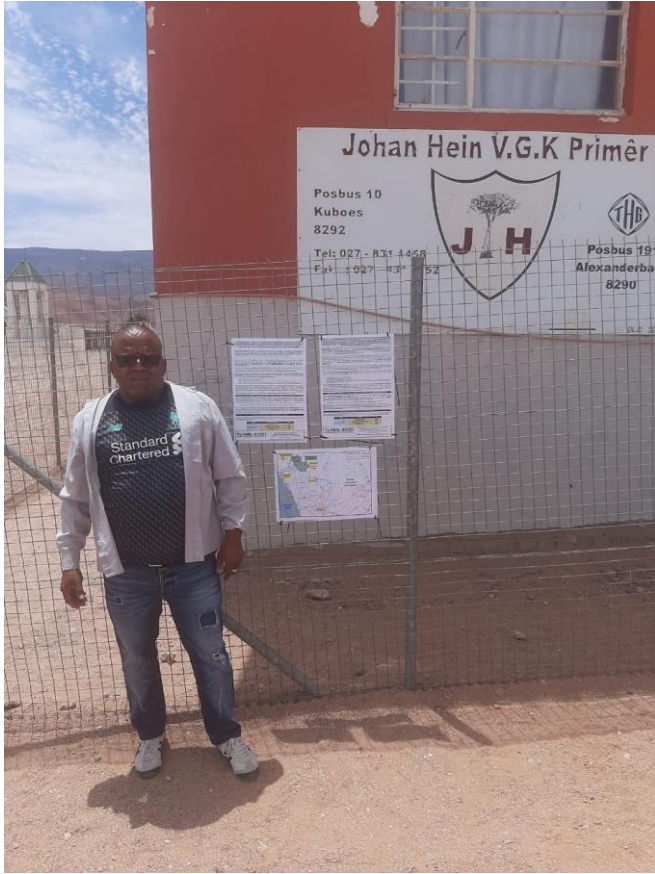
Kuboes-Johan Hein V.G.K Primary