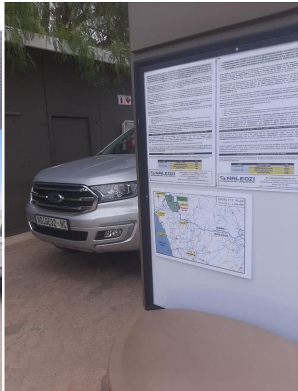
Sendelingsdrift -Total Filling Station