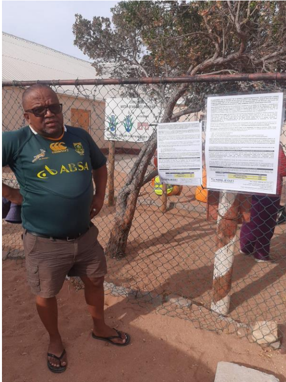
Port Nolloth-Municipal Office