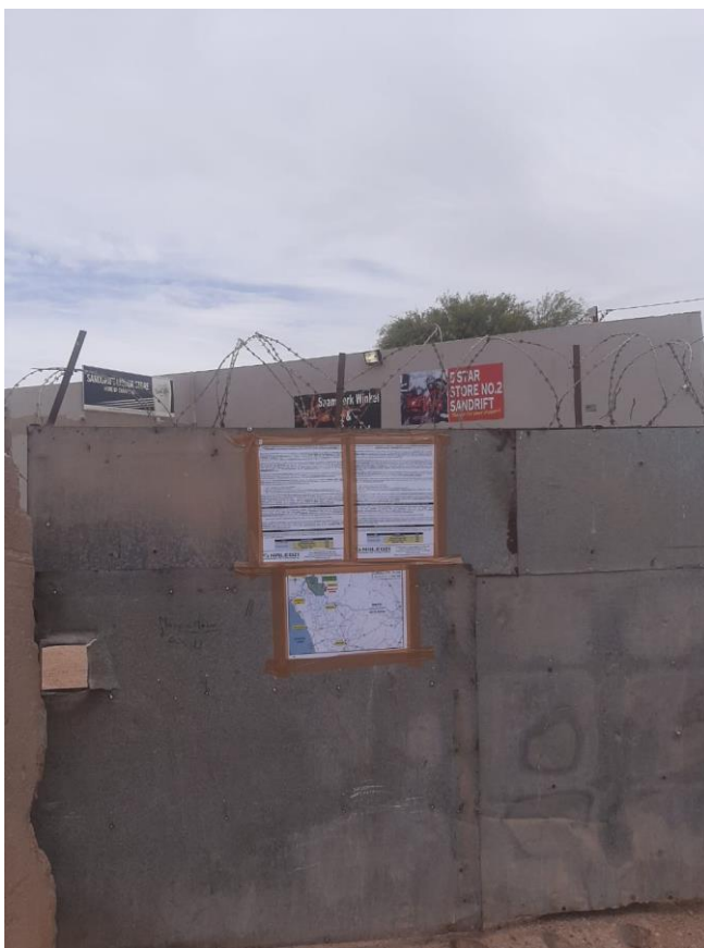
Sanddrift - Drankwinkel