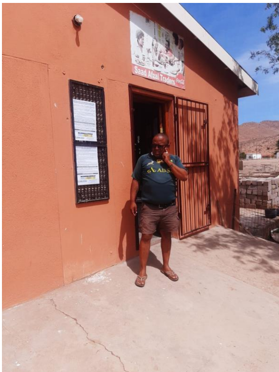
Eksteenfontein- Saal Afzal Traders