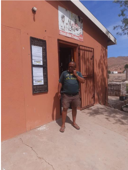
Eksteenfontein- Saal Afzal Traders