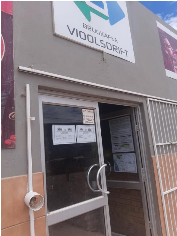
Violsdrift Border Post (Brugkfee)