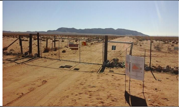
Coordinates: -29.293532, 18.340077 Notice 6: Site Notice placed on the gravel road between the Farm Naip 68 and Farm Nooisabes 51.