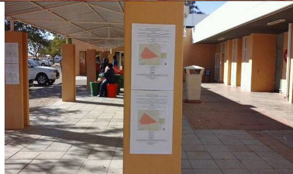
Coordinates: -29.242445, 18.843723 Notice 2: Poster placed at the Aggeneys Pharmacy