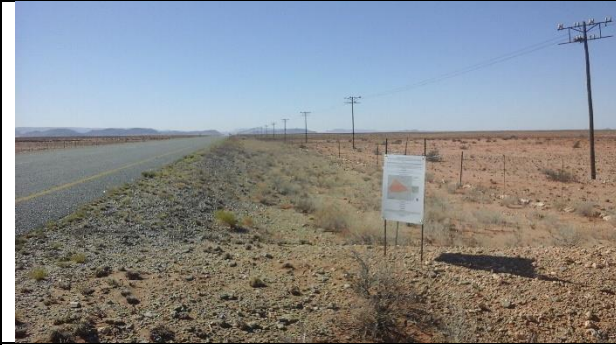
Coordinates: -29.415462, 18.574147 Notice 5: Site Notice placed along the N14.