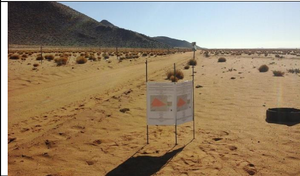
Coordinates: -29.240005, 18.331417 Notice 7: Site Notice placed on the gravel road between Farm Nooisabes 51 and Farm Oonab 52.