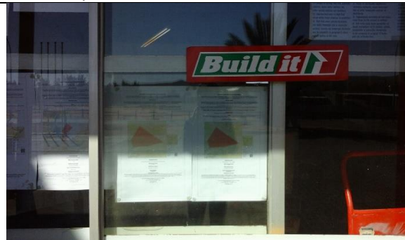
Coordinates: -29.242069, 18.844610 Notice 4: Poster placed at the Aggeneys Garage/ Build It.