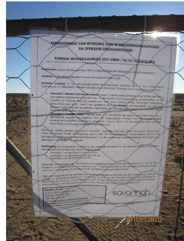
Figure 2: Site Notice placed on the entrance gate to the site along the Poortjies South access road

Co-ordinates: 29°14'48.0"S, 18°53'33.8"E