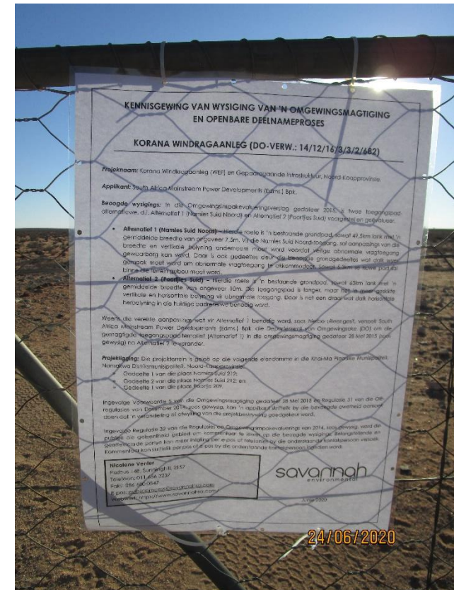
Figure 2: Site Notice placed on the entrance gate to the site along the Poortjies South access road

Co-ordinates: 29°14'48.0"S, 18°53'33.8"E