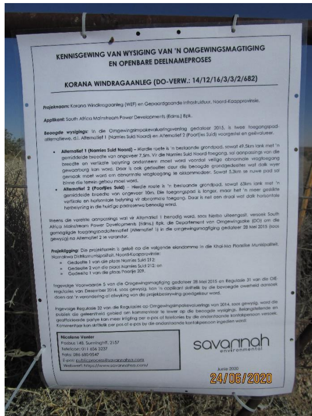
Figure 3: Site Notice placed on the entrance gate to the site along the Namies Suid access road

Co-ordinates: 29°18'11.02"S, 19°12'38.8"E