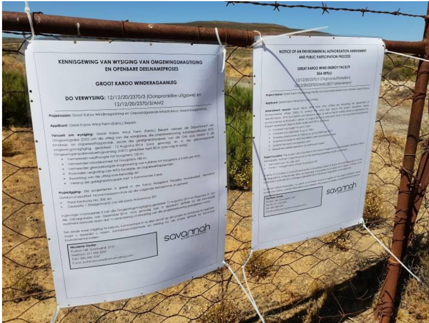
Figure 1: Site notices No. 1: Afrikaans and English –placed on a boundary fence along the unnamed dirt access road providing access to the Great Karoo WEF. Co-ordinate: 32°47'7.57"S; 18°14'26.70"E