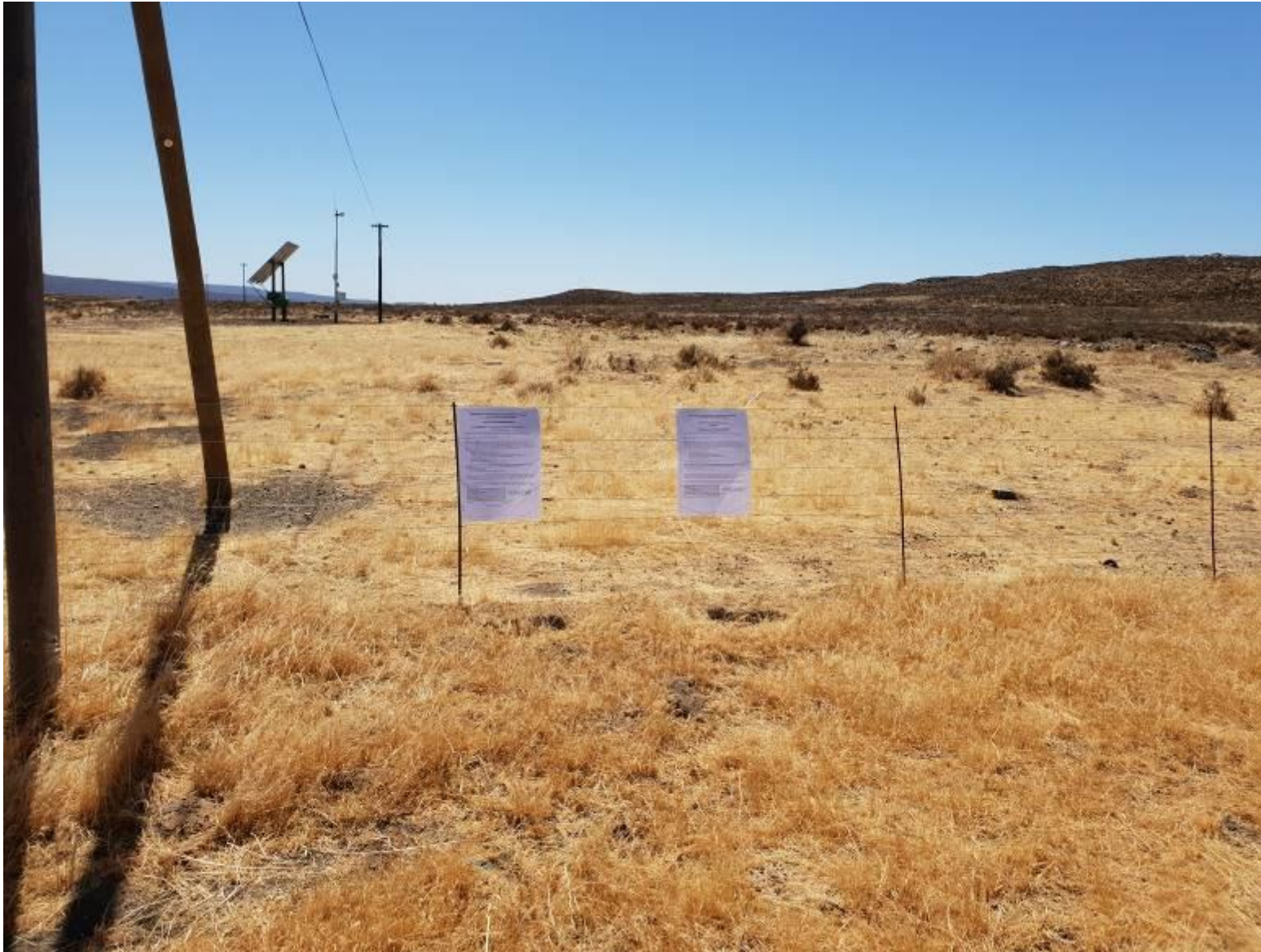
Figure 4: Site notices No. 2: Afrikaans and English –placed on a boundary fence along the unnamed dirt access road providing access to the Great Karoo WEF. Co-ordinates: 32°48'30.02"S; 20°42'38.58"E