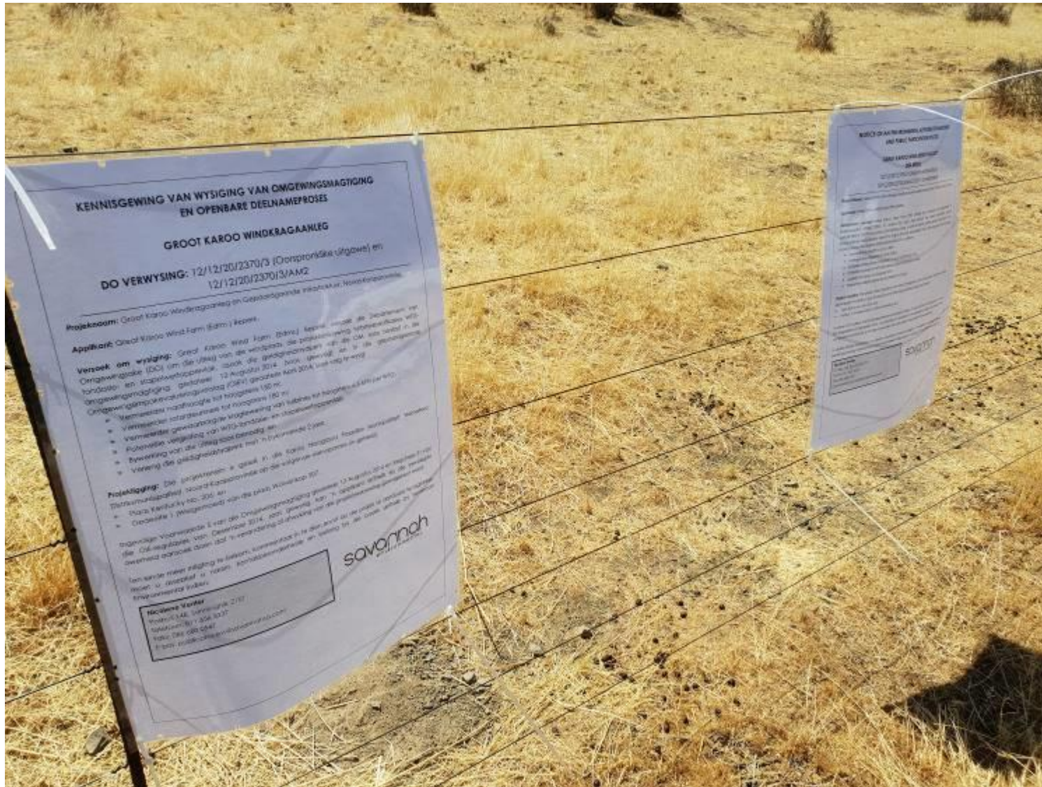
Figure 3: Site notices No. 2: Afrikaans and English –placed on a boundary fence along the unnamed dirt access road providing access to the Great Karoo WEF. Co-ordinates: 32°48'30.02"S; 20°42'38.58"E