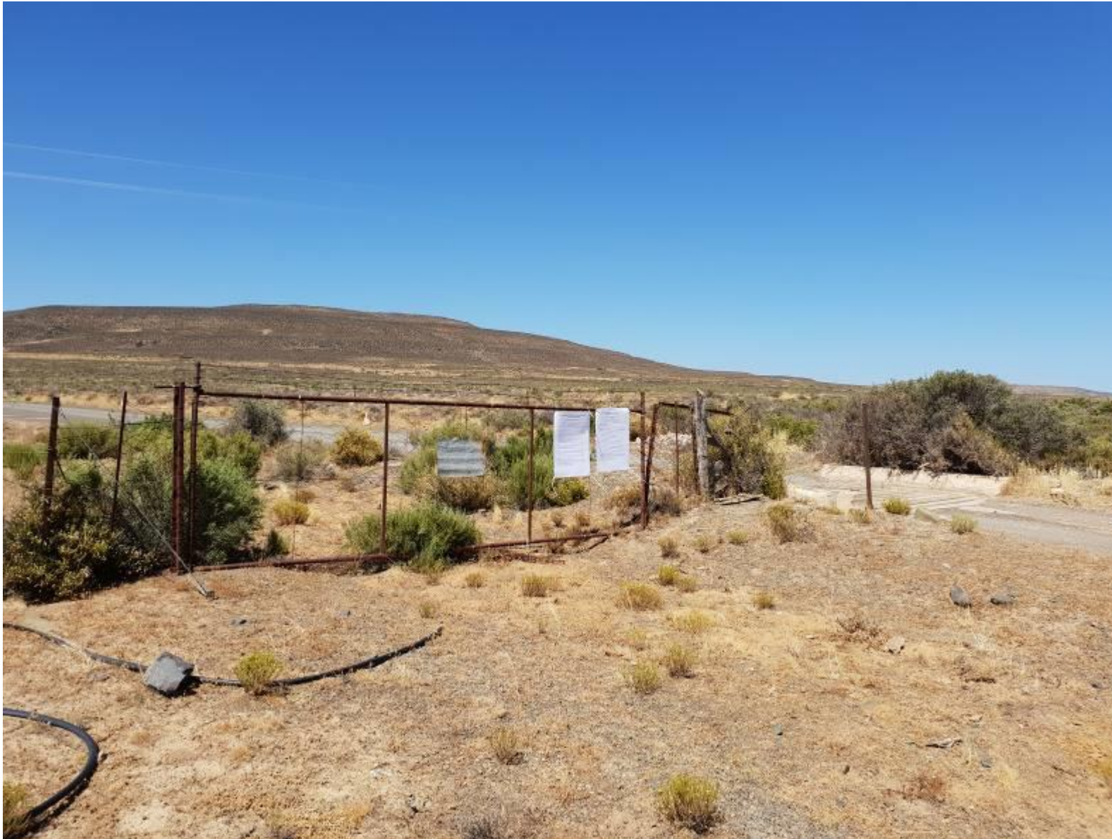
Figure 2: Site notices No. 1: Afrikaans and English –placed on a boundary fence along the unnamed dirt access road providing access to the Great Karoo WEF. Co-ordinates: 32°47'7.57"S; 18°14'26.70"E