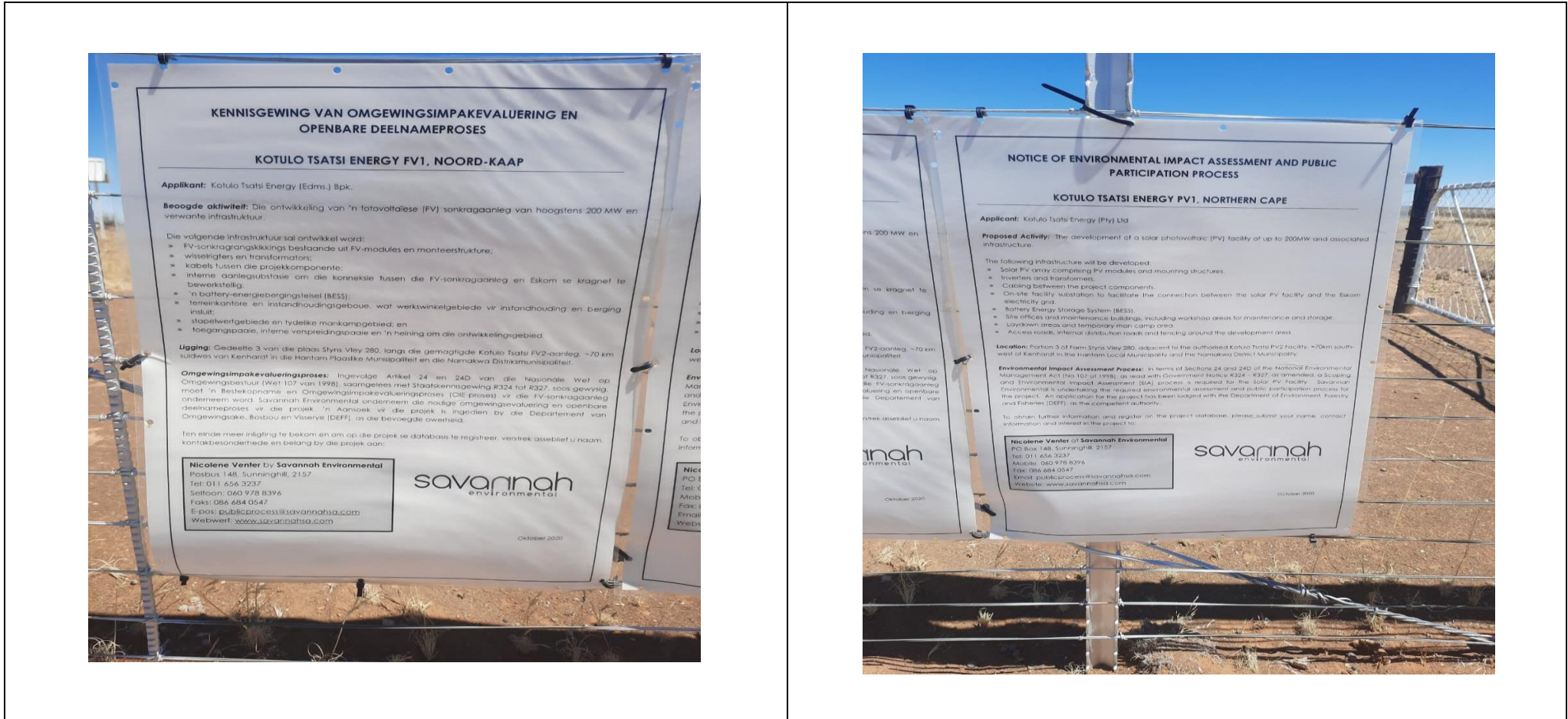
Figure 1: Site Notice placed at the boundary fences of Portion of Farm Styns Vley 280

Co-ordinates: 29°47'54.72"S, 20°36'47.59"E