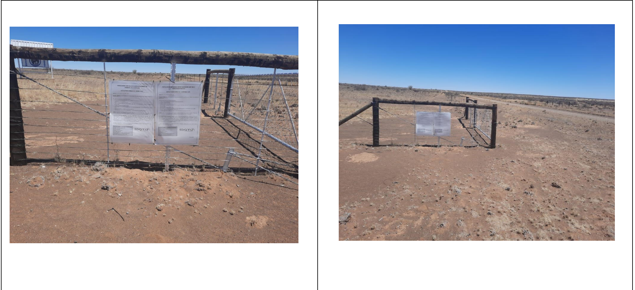
Figure 2: Site Notice placed at the boundary fences of Portion of Farm Styns Vley 280

Co-ordinates: 29°47'54.72"S, 20°36'47.59"E