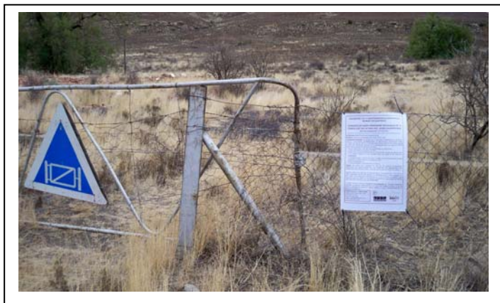
A2 site notice erected on fence of Farm Modderfontein 228