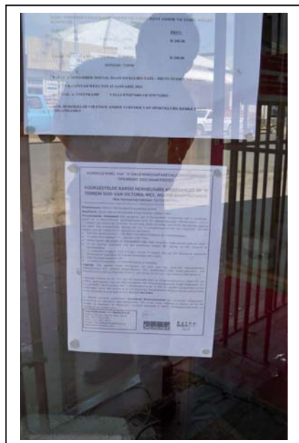
A4 site notice erected at Karoo Vleisboere Co-operation