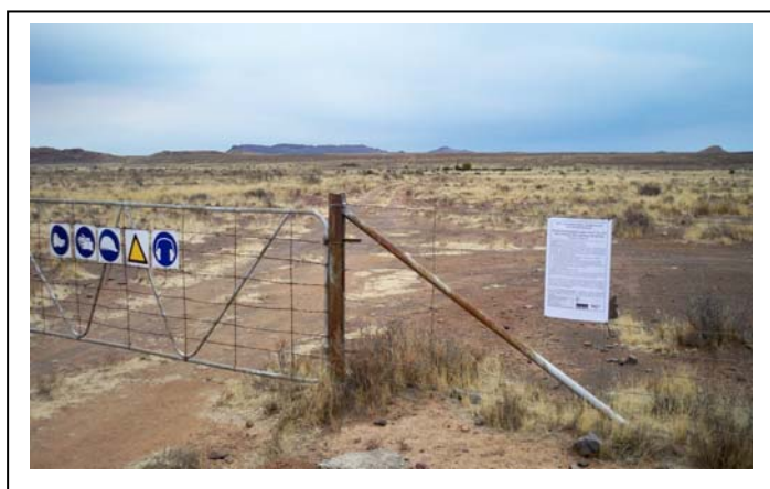
A2 site notices erected on fences of Farms Nobelsfontein 227 and Ezelsfontein 235