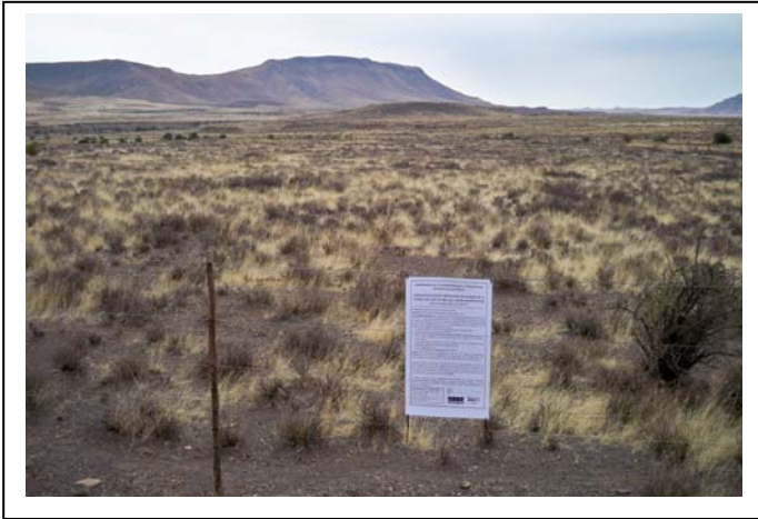
A2 site notice erected on fence of Farm PhaisantKraal1