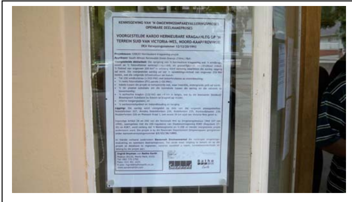
A2 site notice erected at Ubuntu Local Municipality