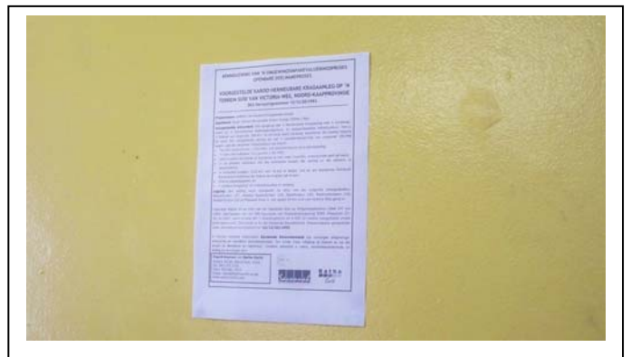
A4 site notices erected at Victoria West Library and Post Office