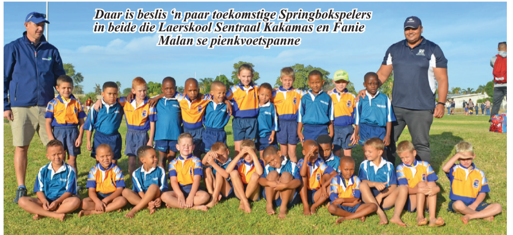
Daar is beslis 'n paar toekomstige Springbokspelers in beide die Laerskool Sentraal Kakamas en Fanie Malan se pienkvoetspanne