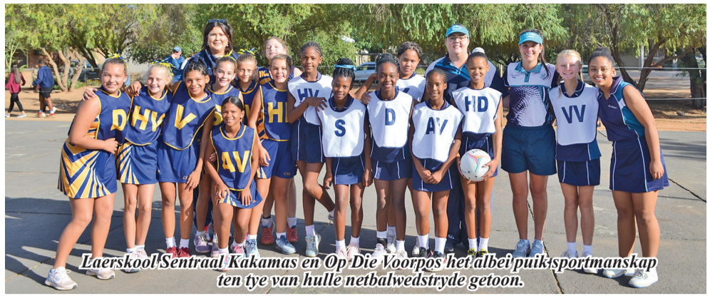
Laerskool Sentraal Kakamas en Op Die Voorpos het albei puik sportmanskappe ten tye van hulle netbalwedstryde getoon.