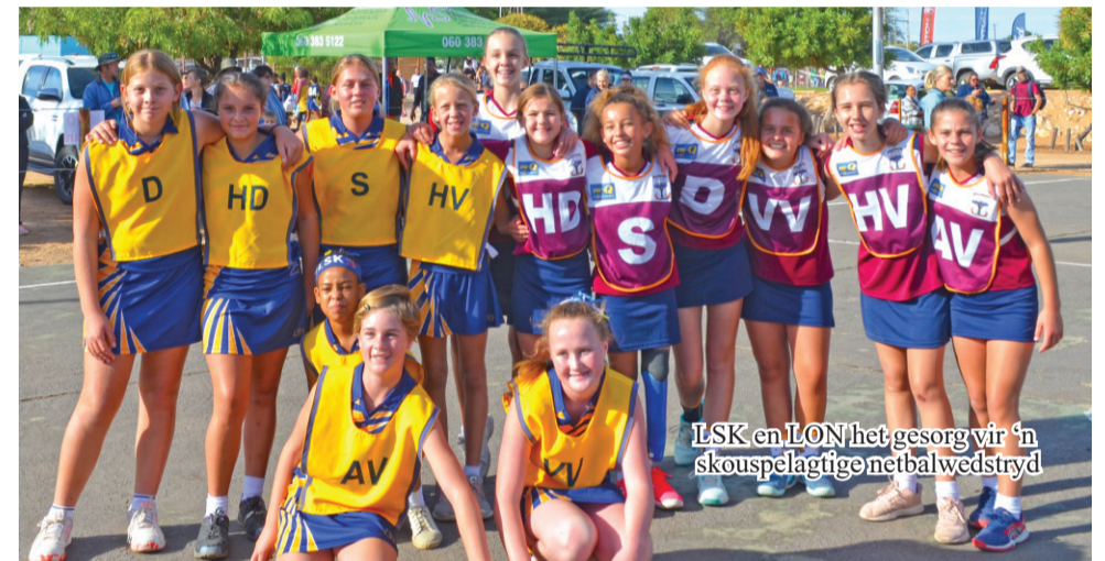
LSK en LON het gesorg vir 'n skouspelagtige netbalwedstryd