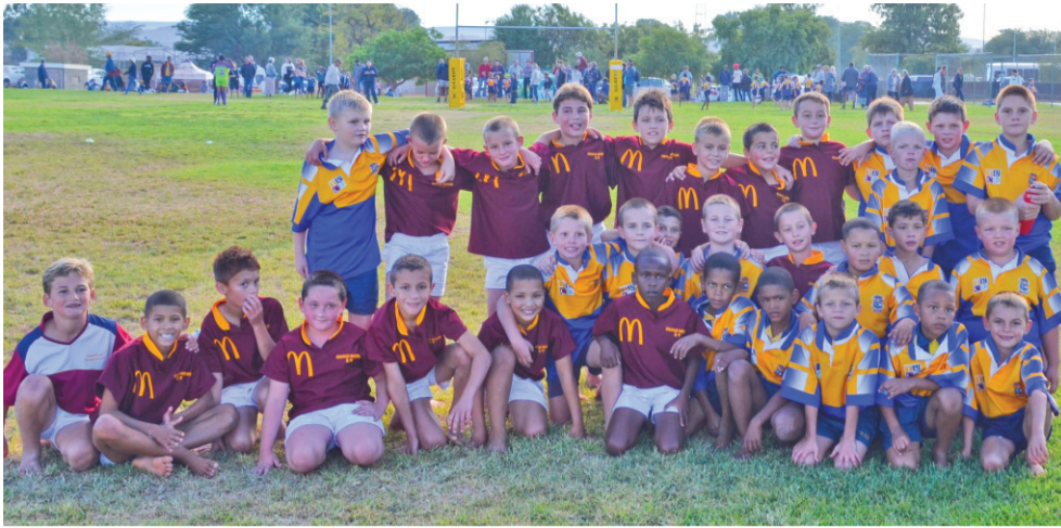
Die LSK rugbybulletjies het hulle harte teen die spannetjie van die Laerskool Oranje-Noord uitgespeel