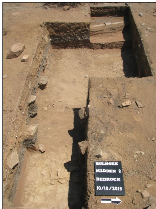
Fig. 2: Opgraving by ashoop.