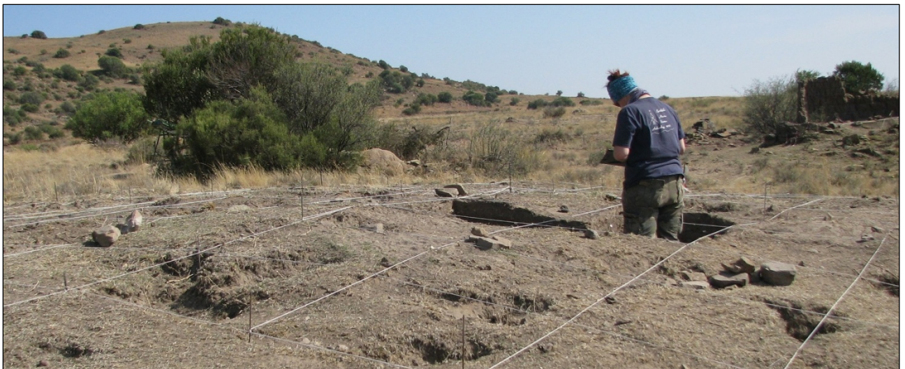
Fig. 4: Opgraving by ashoop met huis in die agtergrond.