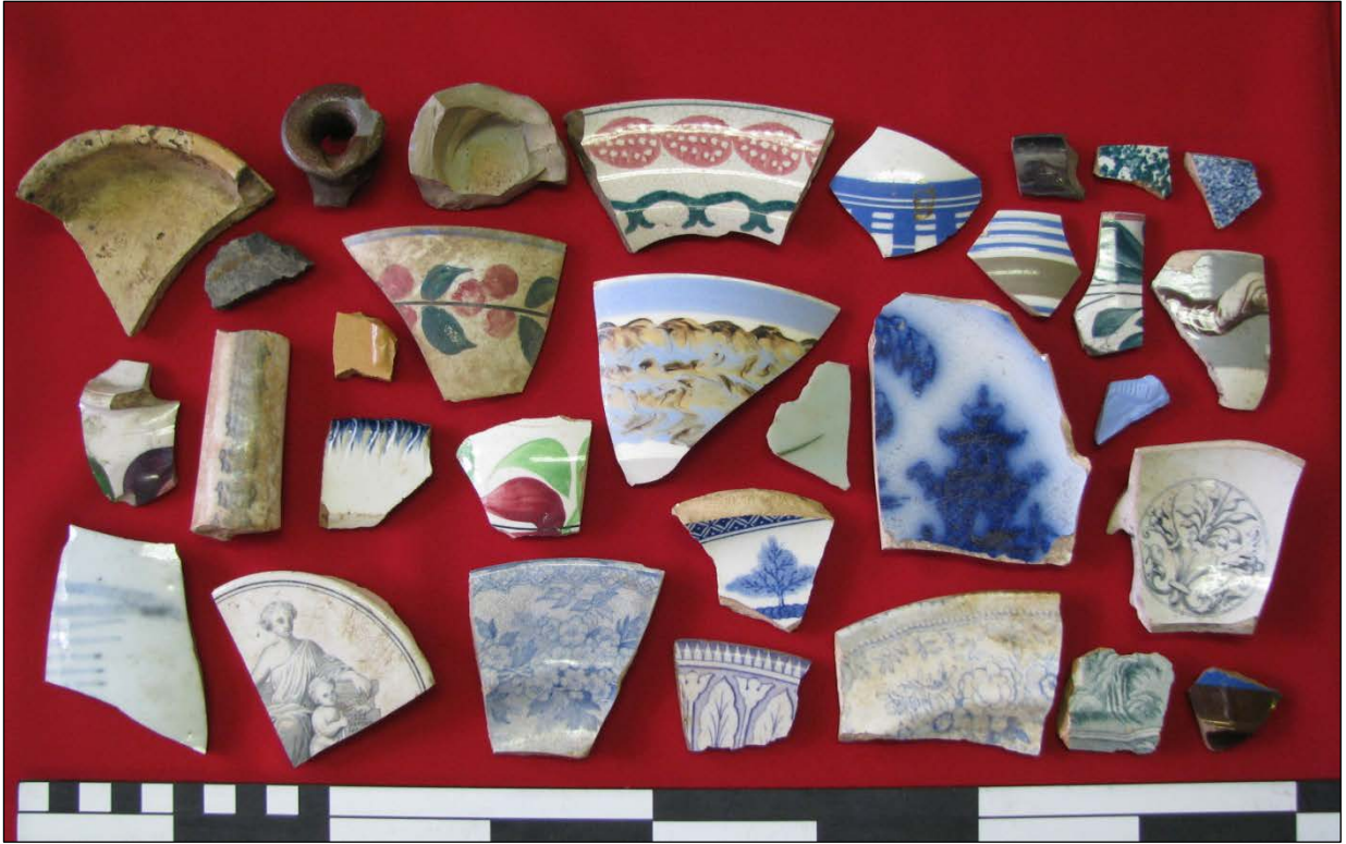
Fig. 3: Keramiekstukke gevind te Bulhoek.