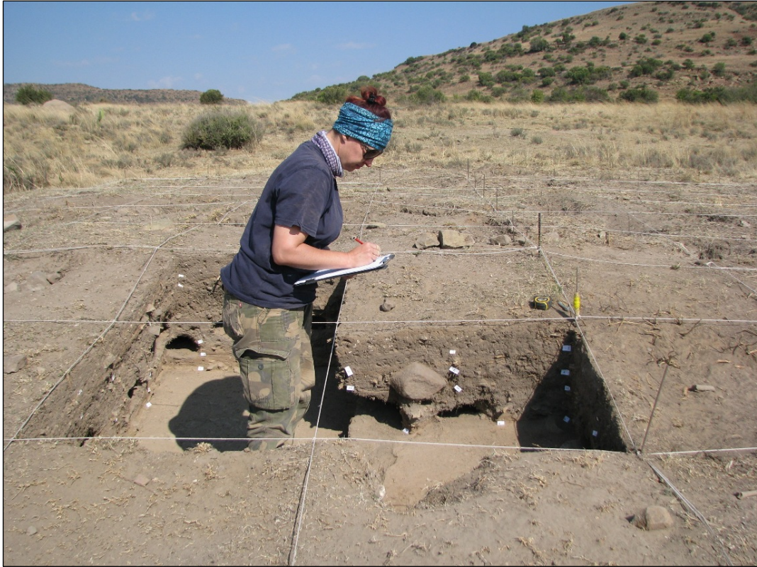
Fig. 5: Opgraving by ashoop.