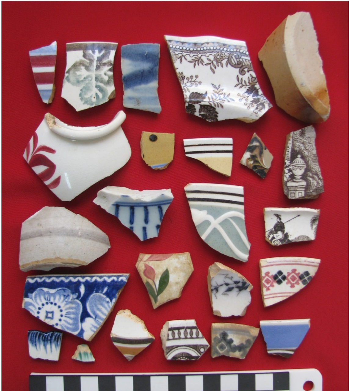
Fig. 10: Keramiekstukke gevind te Mooifontein.