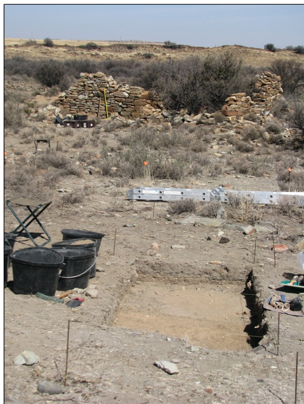
Fig. 8 & 9: Opgrawings by ashope te Mooifontein.