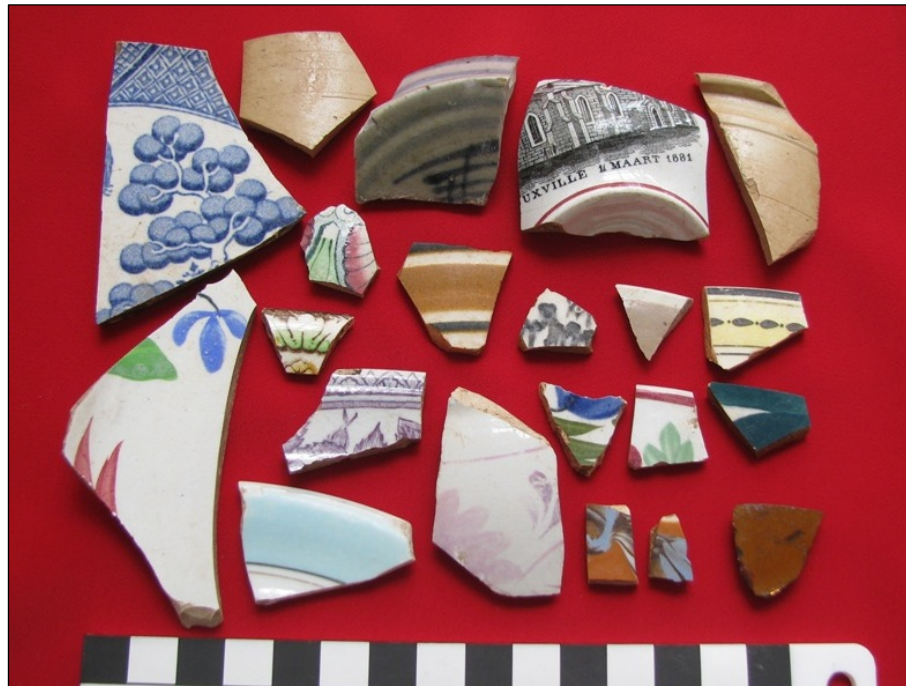
Fig. 6: Keramiekstukke gevind te Leeuspruit.