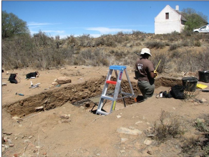
Fig. 1: Opgraving by ashoop met huis in die agtergrond.