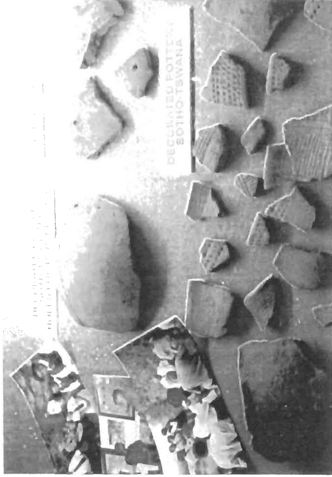
Figuur 1: Versierde Sotho-Tswana potwerk in die sentrale vertoonkas