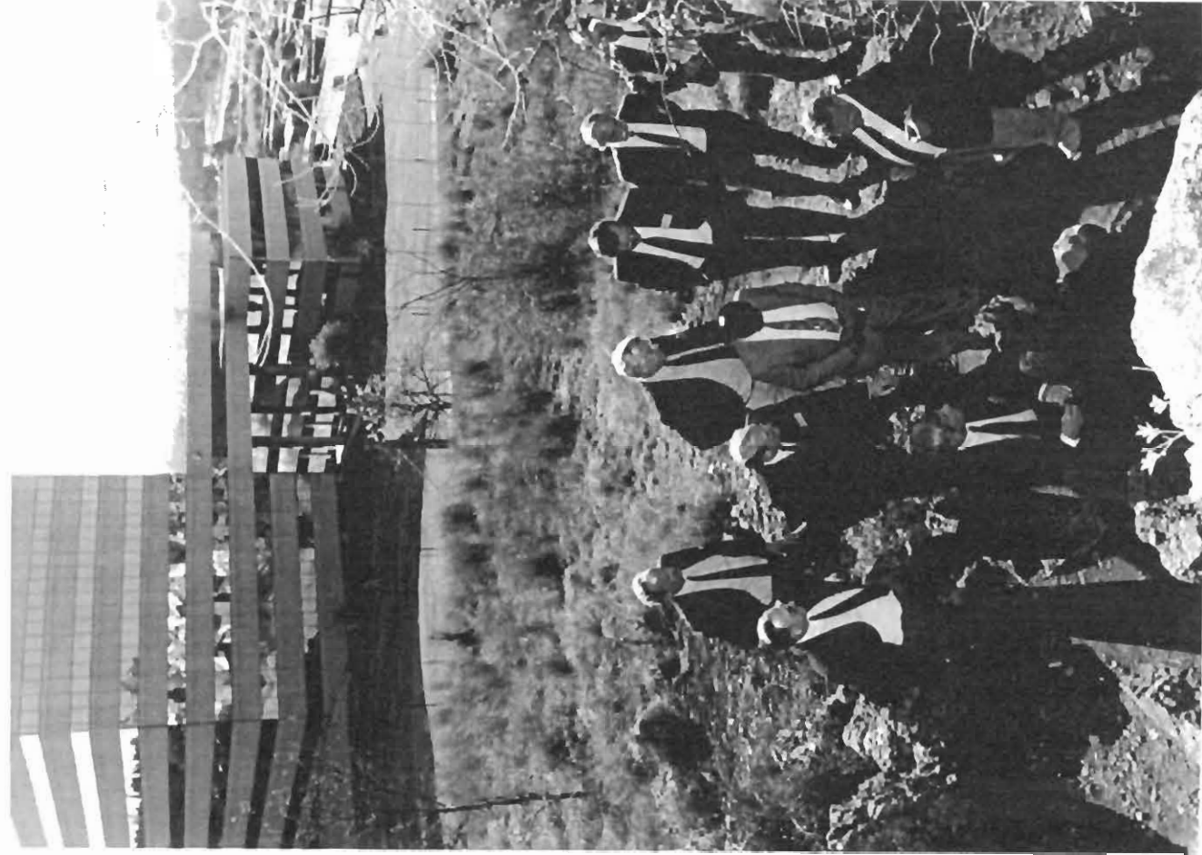
Figuur 5: 'n Groepie gaste word tydens 'n inligtingsdag aan die grot bekendgestel.