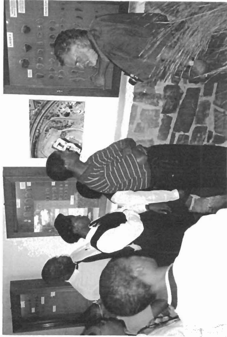
Figuur 4: Skoliere tydens 'n besoek aan die museum